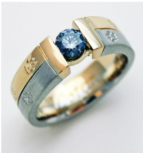
Ring mit Pfotenabdrücken und einem blauen Tierdiamanten.