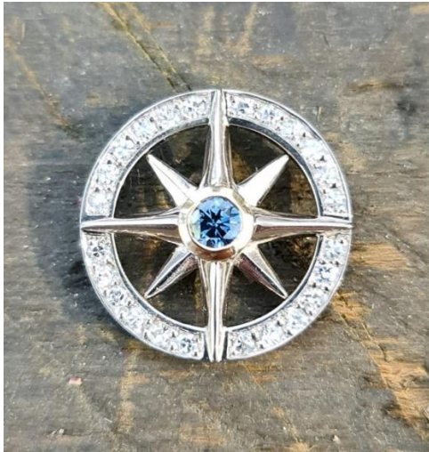
Diese Kompassrose ist ein exklusives Schmuckstück mit einem 17 mm großen Tierdiamanten und einer Umrandung, besetzt mit vielen kleinen Diamanten.