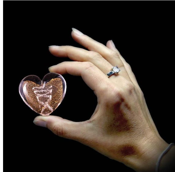
Handschmeichler mit Aschespur und Blattgold. Jedes Herz ist ein Unikat mit Zertifikat.