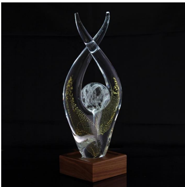
Gläsernes Kunstwerk mit der Asche des verstorbenen Tieres, veredelt mit Blattgold.

Mit einer kleinen Menge Asche des verstorbenen Tieres und verschiedenen Farben kreieren Glasdesigner kunstvolle Gedenkkristalle, jeder ganz besonders und ein Unikat.