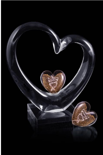
„Heart-in-Heart“-Set. Das Herz mit der Asche des Tieres kommt in der gläsernen Herzskulptur besonders schön zur Geltung.